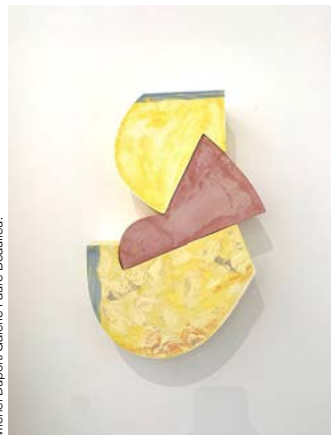
Michel Dupont/Galerie Faure Beaulieu.