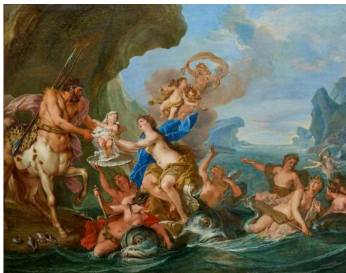
Nicolas Bertin (1667-1736), Achille confié par Thétis au centaure Chiron (c. 1725), huile sur toile, 62 x 79 cm.

La foire belge renforce son secteur des arts anciens, mais les arts des XXe et XXIe siècles se taillent toujours la part du lion.