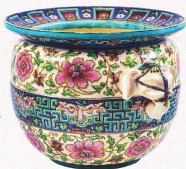
Théodore Deck, Cache-pot avec une frise florale en ceinture et anses d'éléphants , France, vers 1870, céramique.