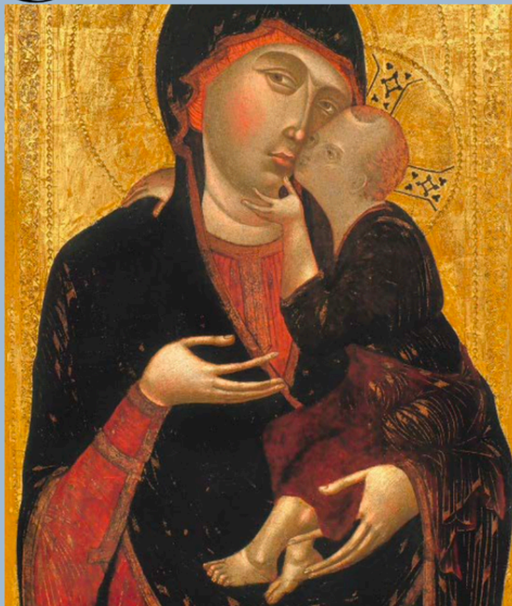
↑ Attribué à Duccio di Buoninsegna, Vierge à l'Enfant , v. 1280-85, tempera, laque, or et argent sur panneau, 70,2 x 45,7 cm © GALERIE G. SARTI.