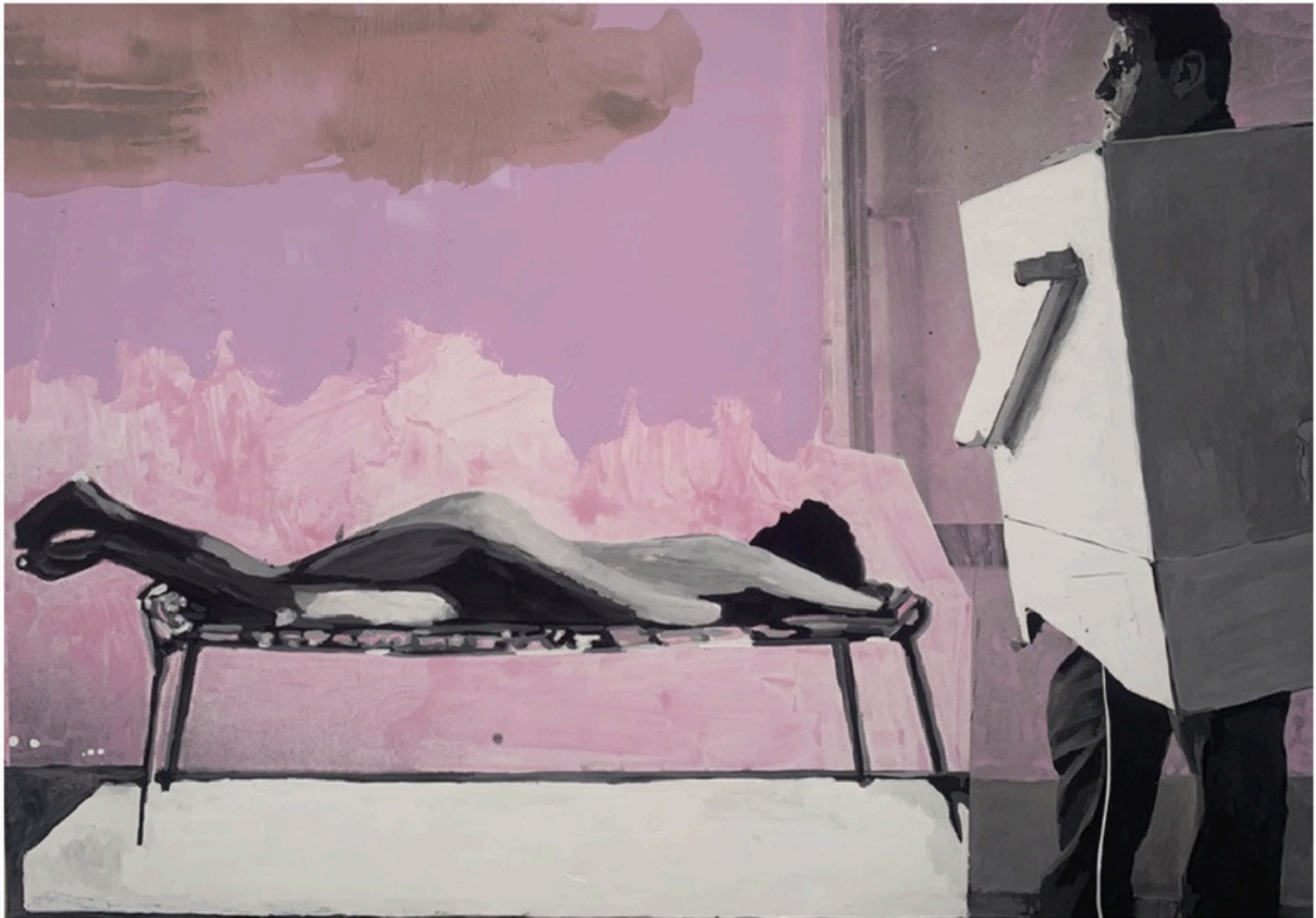
Franz West, S. T. , de la série « Transfigured Past », détail, 2009, sur le stand de la galerie Wienerroither & Kohlbacher, Art Paris 2026, Grand Palais, Paris, 2026.